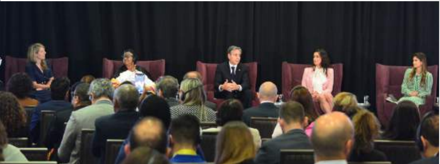
Durante la sesión sobre Gobernabilidad Democrática, las voceras junto a Mélanie Joly, Ministra de Asuntos Exteriores de Canadá; y Antony J. Blinken, Secretario de Estado de los Estados Unidos.